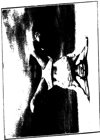
इट्रियान ( बर्गोसलनमें )